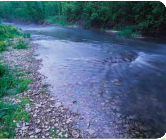
Río Root en el sudeste de Minnesota